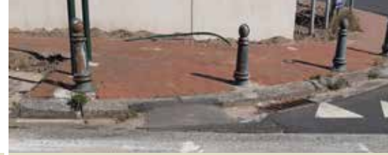
Op zijn Moerbeeks (p. 3)