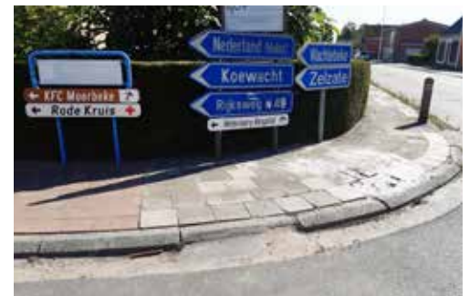
▲ Op zijn Moerbeeks.