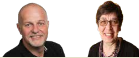
Oost-Vlaanderen lanceert relanceplan (p. 2)