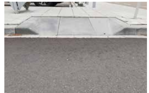
▲ Zo hoort het.

Als we zien hoe de stoepranden her en der werden aangepast voor voetgangers en mindervalide weggebruikers, dan is het duidelijk dat er geen interesse is voor dit probleem of dat er geen geld is om dat volwaardig aan te passen. Op de foto's hierboven ziet u zelf hoe de gemeente Moerbeke dat aanpakt en hoe het beter kan.