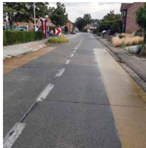
▲ De fietssuggestiestrook aan school De Zonnebloem werd niet doorgetrokken.

Hoe ernstig moeten we de belofte van veilige fietspaden nemen? In onze gemeente zijn er zo'n 84 straten. In 17 straten is er een fietspad, al dan niet in goede staat. Om het fietsen te kunnen promoten, moet het fietsennetwerk prioritair worden uitgebreid en verbeterd. Een kostenplaatje? Zeker maar absoluut noodzakelijk vooraleer de verkeerslus wordt ingevoerd.