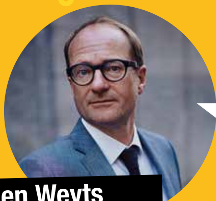
Ben Weyts Vlaams minister van Onderwijs

Veel Vlamingen snakten naar de heropening van de scholen. Heel wat ouders wilden hun kinderen weg van achter de pc thuis, en weer op de schoolbanken. Leerkrachten misten de kinderen. En onze jongeren misten hun vrienden.