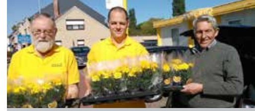
Bloemen op Moederdag p. 2