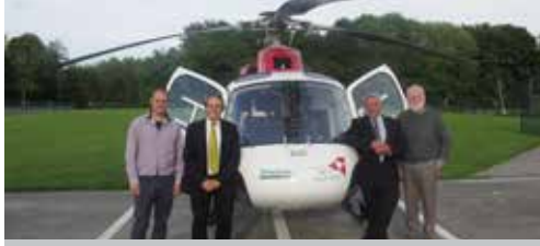
Nieuws uit de gemeenteraad p. 2